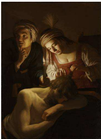
© The Cleveland Museum of Art. Mr. and Mrs. William H. Marlatt Fund 1968.23